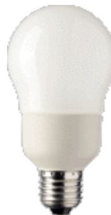
PL-E Ambiance 12W E27 A65/A65B