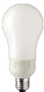
PL-E Ambiente 23W E27 A70/A75/A75A