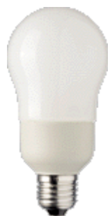
PL-E Ambiance 16W E27 A65