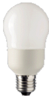
PL-E Ambiance 9W E27 A60C