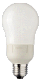
PL-E Ambiance 16W E27 A65