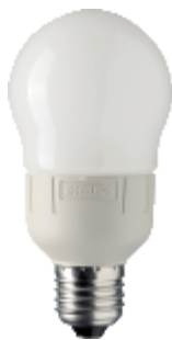
PL-E Ambiance 9W E27 A60C