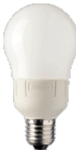
PL-E Ambiance 12W E27 A65/A65B