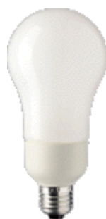
PL-E Ambiente 23W E27 A70/A75/A75A