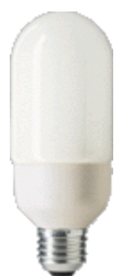
Exterieur ES 9W E27